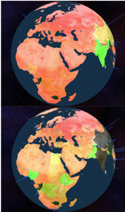
Figura 4. Indicador rácio natalidade-mortalidade mapeado na cor dos países. Quando não-filtrado (em cima) a cor da maioria dos países é uniformemente vermelho e indistinguível entre eles. Quando a China e Índia são filtrados (em baixo), a maioria das cores são distinguíveis e os países com melhor rácio (mais perto do verde) são mais facilmente detetáveis.

Durante o desenvolvimento consideraram-se diferentes formas de representação tri-dimensional de atributos que variam ao longo de um período de tempo, tal como a representação filtrada, onde os dados seriam filtrados de modo a se apresentar apenas um único ano de cada vez, selecionado pelo utilizador e a representação em lápis [CT05]. Esta segunda implicaria a introdução de um objeto adicional por cada país com a forma geométrica de um lápis, onde cada face é colorida desde ponta de carvão (localizado geograficamente no país) até ao cabo deste para representar os valores do primeiro até ao último AR. No entanto, esta representação iria gerar um congestionamento visual, tornando a leitura e comparação entre barras verticais ou entre lápis mais difícil, principalmente para países de pequena dimensão. Assim, optou-se pela representação filtrada, implementando um segundo slider horizontal para o utilizador "deslizar" de forma sequencial entre valores de AR.