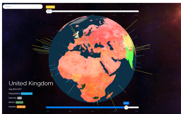
Figura 2. "Living Globe" a apresentar dados demográficos de 2010 e com Reino Unido selecionado, mostrando detalhes textuais deste no canto inferior esquerdo.

aproximando as cores do amarelo, no caso das barras, e do verde, no caso dos países. Isto permite que representações de componentes semelhantes possam potencialmente ter uma maior diferenciação, sendo por isso mais facilmente comparáveis e legíveis visualmente.